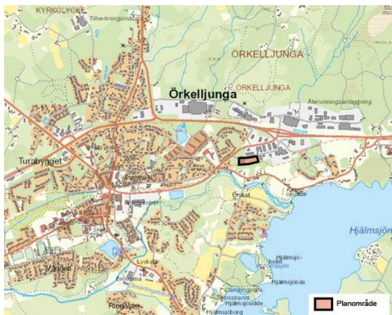
Figur 2: Planområdet ligger i industriområdet i östra delen av Örkelljunga.

Planområdet ligger på industriområdet i östra delarna av Örkelljunga. Fastigheten som berörs är Städet 1. Planområdet är 9958 kvadratmeter stort och idag bebyggt med en industribyggnad om ca 1880 kvadratmeter i västra delen av fastigheten.