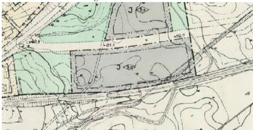
Figur 4: Utsnitt ur gällande plan, som anger industriändamål.