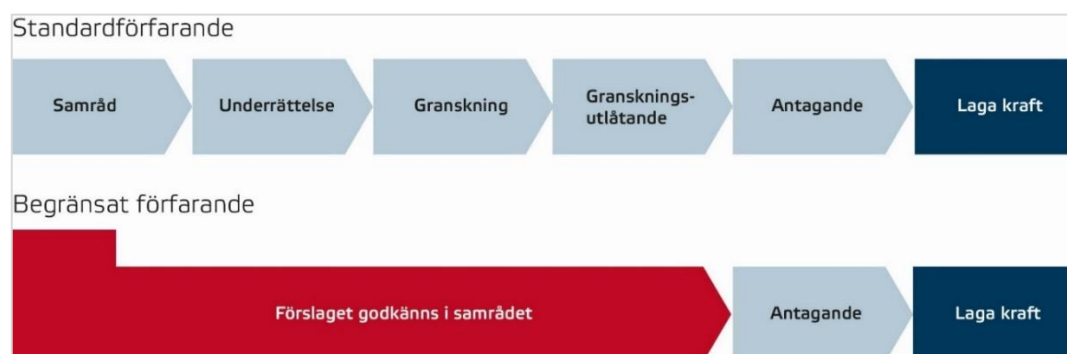
Figur 1: Processen vid standardförfarande och processen vid begränsat standardförfarande. Illustration: Boverket.

När kommunen har tagit fram ett planförslag ställs detta ut på samråd, där allmänheten, berörda sakägare, Länsstyrelsen och Lantmäterimyndigheten kan framföra synpunkter på förslaget. Dessa synpunkter, tillsammans med kommunens respons på synpunkterna samlas i en samrådsredogörelse.